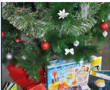
O punto de recollida situado na cafetería Lamarita da Cidade Universitaria.