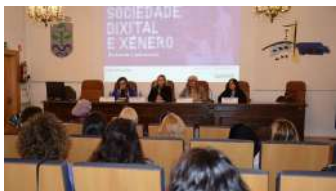
Inauguración das xornadas no salón de actos da EU de Estudos Empresariais.