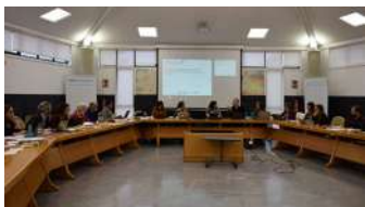
Arranque da reunión na sala de xuntas da Escola de Enxeñaría de Telecomunicacións.