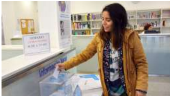
A iniciativa desenvolveuse na entrada da Biblioteca Rosalía de Castro.