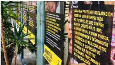
A exposición pode verse ba Facultade de Belas Artes.

O Centro de Investigación Mariña da Universidade de Vigo repite éxito rotundo de participación nas actividades organizadas esta fin de semana ao abeiro da segunda edición do programa Ciencia Singular, un plan de divulgación científica e tecnolóxica cofinanciado pola Xunta de Galicia e pola Unión Europea a través de fondos FEDER co que se busca dar a coñecer á sociedade o traballo levado a cabo nos centros singulares de investigación da universidade viguesa. +info.