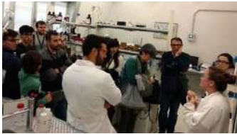
Taller sobre CO2.

2609 horas de estudo realizadas por 95 persoas que se converten en diñeiro solidario para dous proxectos de empoderamento de mulleres de Ecuador e República Democrática do Congo. Con estas cifras péchase a participación da Biblioteca Rosalía de Castro do campus de Ourense na Olimpiada Solidaria de Estudo , iniciativa internacional organizada por ONGD Coopera, Cooperación Internacional e ACTEC, que tivo lugar do 5 de novembro e ata o 5 de decembro. +info.