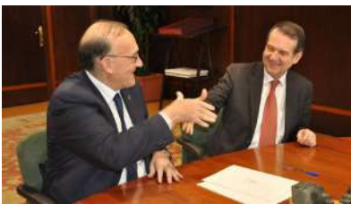
Reigosa e Caballero tras asinar o convenio.