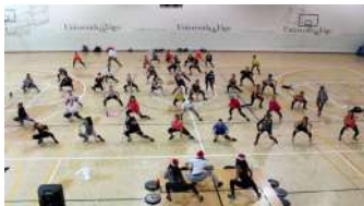
Imaxe da sesión celebrada no pavillón de deportes.

Como cada ano, a Unidade de Igualdade da Universidade de Vigo crea un calendario que aborda diversas temáticas dende unha perspectiva de xénero. O almanaque proposto para este 2020 repasa medidas conceptos e propostas para que a Universidade se consolide como un espazo libre de violencia de xénero e por razón de sexo. Un dos seus eixos centrais é o Protocolo de actuación para a prevención e a sanción do acoso, medida posta en marcha no ano 2015 pola UVigo, seguida dunha diagnose dos datos recollidos que se publicou en 2018 e se converteu en pioneira, non só na institución viguesa, senón que en todo o país. +info.