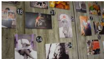
A iniciativa naceu no marco dunha das materias de Educación Social.

Os mecanismos para a extracción do ADN, a metástase do cancro, a utilidade do CO2 como extintor de lumes ou como o cerebro xestionada o sentido da orientación. Estes son algúns dos segredos que agocha a investigación biomédica e que preto de medio de cento de persoas puideron coñecer na xornada de portas abertas que o Cinbio celebrou dentro do programa Divulgando Ciencia Singular. +info.