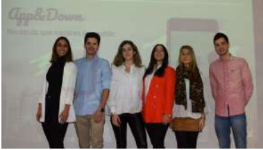
Equipo creador da aplicación App-Down.