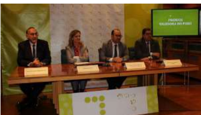
Os reitores destacaron o papel das súas institucións para manter unhas políticas que están sendo cuestionadas.

Que os problemas económicos non sexan un impedimento para que o alumnado poida desenvolver os seus estudos na Universidade de Vigo. Con este obxectivo o concello vigués achegará 350.000 euros á institución académica, que deste xeito verá complementados os seus programas propios de bolsas e axudas destinadas ao alumnado con dificultades económicas. +info.